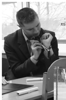
...Mokytis ir studijuoti niekada nevelu...