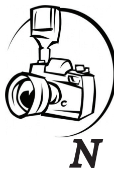
Draugo ištikimybė reikalinga ir laimėje, ir nelaimėje, bet alkanam – ji tiesiog būtina.