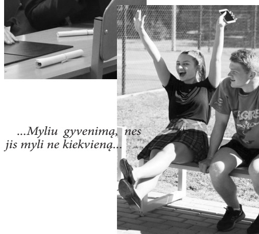
...Myliu gyvenimą, nes jis myli ne kiekvieną...