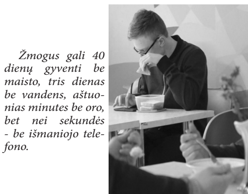
Žmogus gali 40 dienų gyventi be maisto, tris dienas be vandens, aštuonias minutes be oro, bet nei sekundės - be išmaniojo telefono.