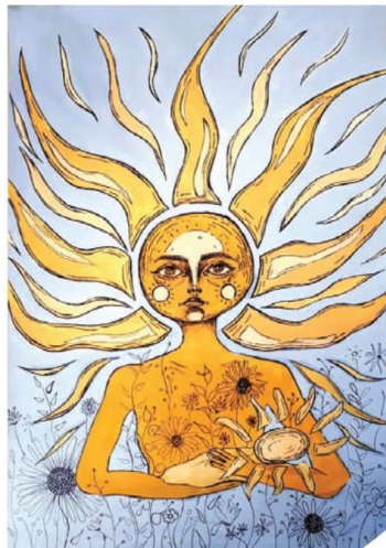
▲ 2 vieta. Vilkaviškio „Aušros“ gimnazijos mokinė Barbora Ramanauskaitė (mokyt. Reda Viktažentienė).