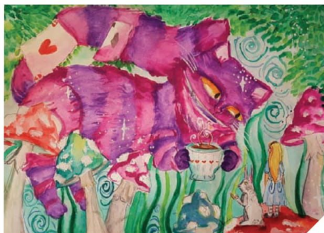
▲ 3 vieta. Vilkaviškio „Aušros“ gimnazijos mokinė Upė Čivinskaitė (mokyt. Jurgita Rutkauskienė).