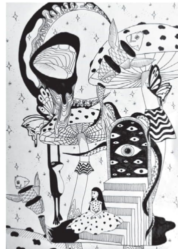
▲ 2 vieta. Vilkaviškio „Aušros“ gimnazijos mokinė Gabija Tumasaitė (mokyt. R. Viktažentienė).